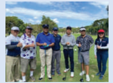
KWI Agency Golf Day