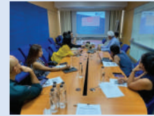
Training Agent - Business Interruption

เบี้ยประกันภัยสูงขึ้นถึง 45% เทียบจากปี 2562 ด้วยอัตราส่วนสินไหมทดแทน 38%